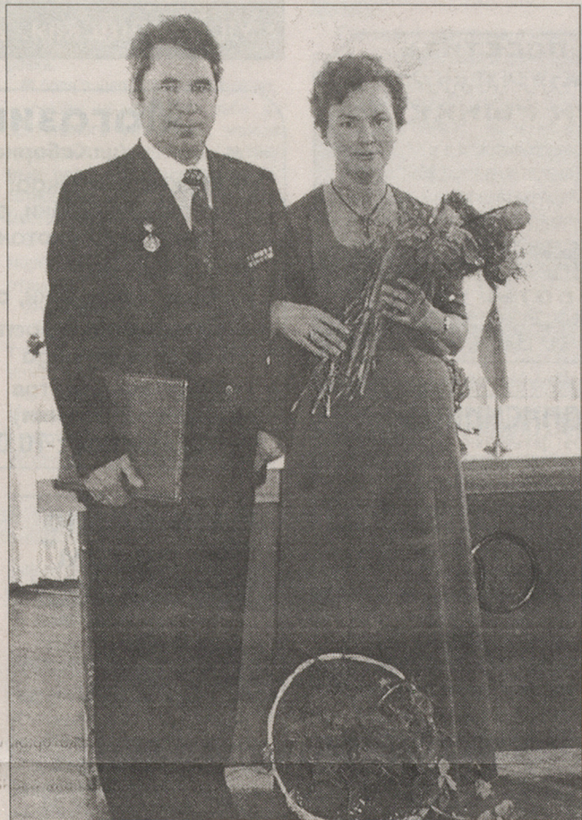
В 1981-м они отметили серебряную свадьбу